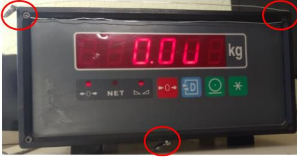
Şekil 2 İndikatör ve Kalibrasyon Anahtarı Damgası