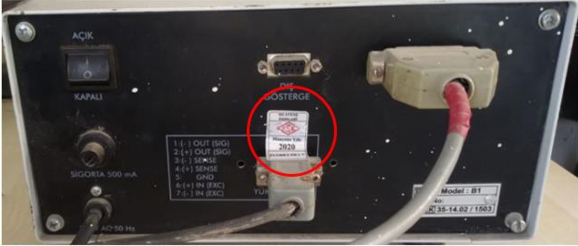
Şekil 3 Loadcell Kablo Damgası

Aşağıda verilen Şekil 3'de olduğu gibi delikli vida üzerinden kurşun damgalama yapılamıyor ise, yük hücrelerinden gelen bağlantı ucu indikatöre muayene damgası kullanılarak damgalanır.