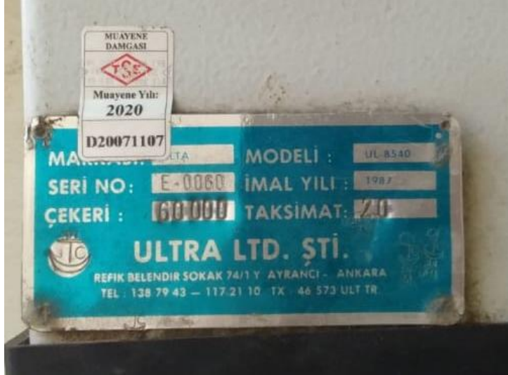
Şekil 5 Ürün Etiketi

Ürün etiketi tartı aletinin marka modeline bakılmaksızın damgalanmalıdır. Şekil 5'te ürün etiketi örnek damgalaması gösterilmiştir.