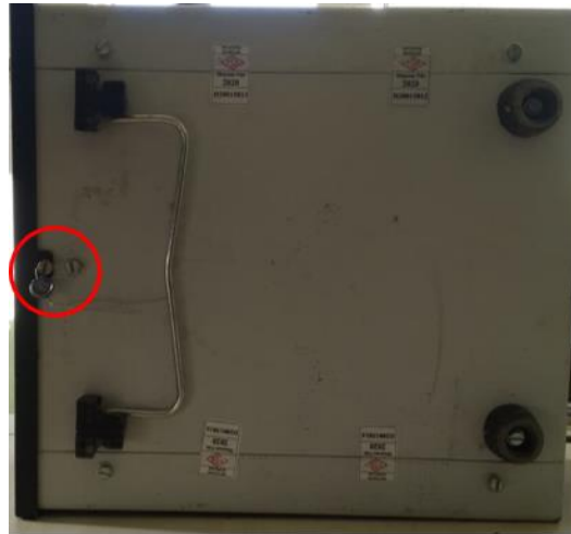
Şekil 1 Kalibrasyon Anahtarı ve İndikatör Damgası

Tartı aletinin parametre değişimi veya ağırlık ayarının yapılmaması için resimde gösterilen kalibrasyon anahtarı vidasının sökülmemiş olması gerekmektedir. Kalibrasyon anahtarına erişimin indikatörün dışından olduğu gibi içinden erişimin de engellenmesi gerekmektedir. Bu nedenle indikatörün altında (Kalibrasyon anahtarının bulunduğu kısım) ve indikatörün ön yüzünde olması gereken damgalar Şekil 1 ve Şekil 2’de gösterilmiştir.